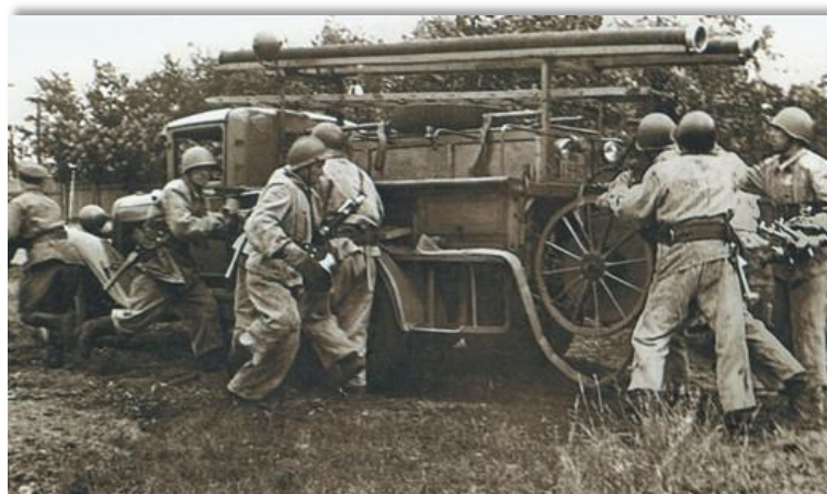
Воины-пожарные ликвидируют последствия налетов фашистской авиации на Москву, 1941г.

С начала Великой Отечественной войны пожарные городов нашей Родины, выполняя свой долг, внесли достойный вклад в их оборону. Как не старался враг поджечь с воздуха стратегически важные объекты на нашей территории, ему это не удавалось. Воины-пожарные, при активной поддержке добровольцев, свели на нет усилия противника. Основная тяжесть в ликвидации последствий налетов фашистской авиации легла на плечи пожарных. И они с честью выдержали это испытание.